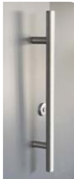
Griffstangen rund 2 Stück je Tür