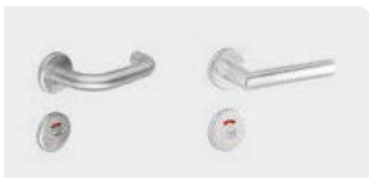
Drückergarnitur U-Form oder L-Form