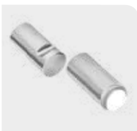
Haken und Puffer